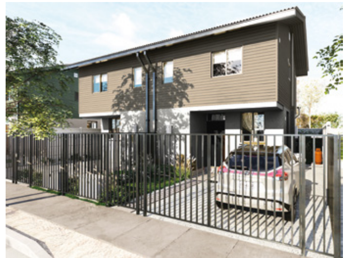
Sevilla - 64 m2 3 DORM 2 BAÑOS

Si es independencia, es para toda la vida