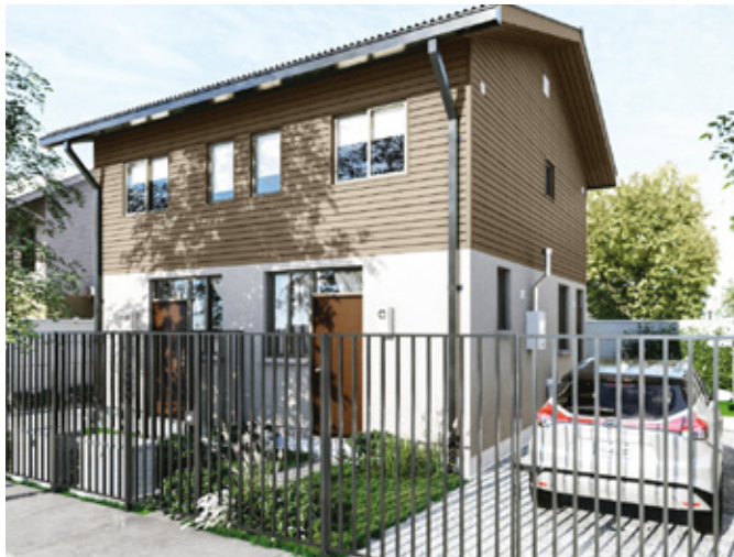
Valencia - 54 m2 2 DORM 2 BAÑOS