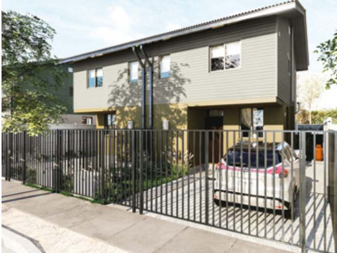
Málaga - 64 m2 3 DORM 1 BAÑO