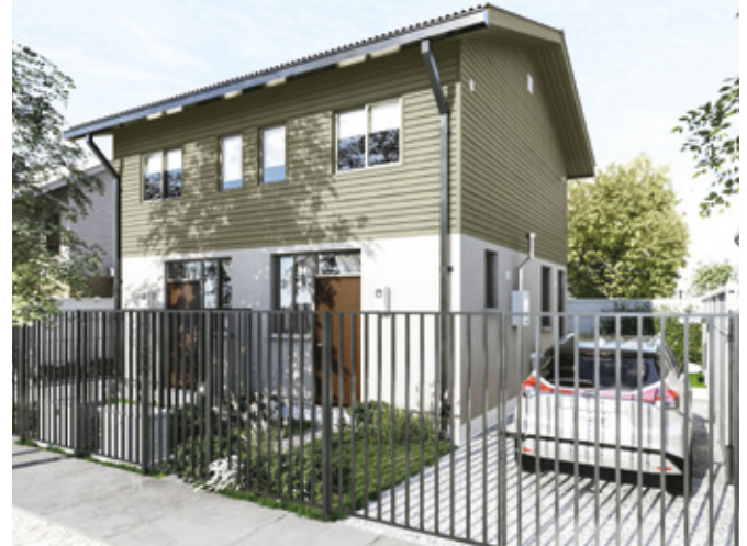
Toledo - 54 m2 2 DORM 1 BAÑO